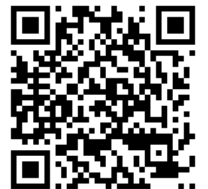
▲造紙相關操作影片