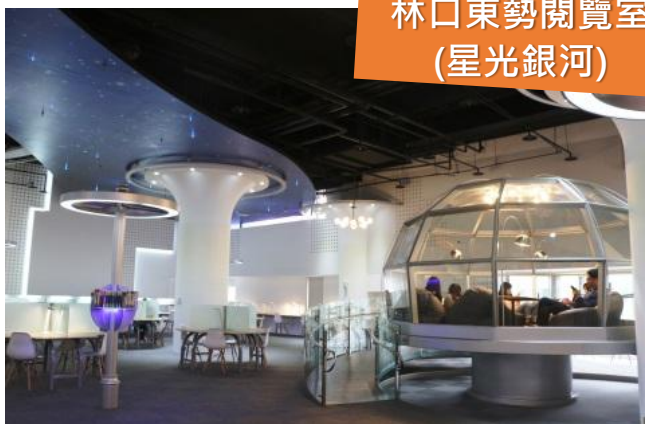
林口東勢閱覽室 (星光銀河)