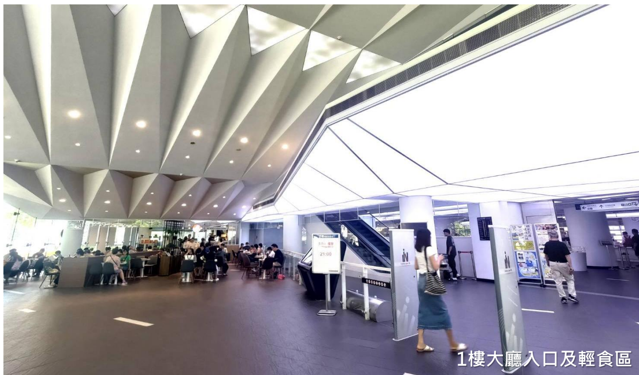
1樓大廳入口及輕食區