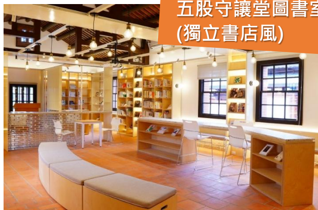
五股守讓堂圖書室 (獨立書店風)