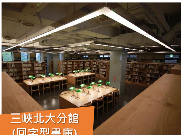
三峽北大分館 (回字型書庫)