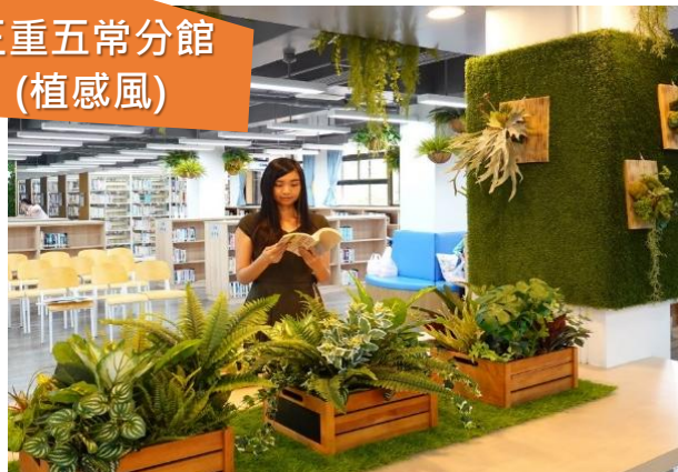
三重五常分館 (植感風)