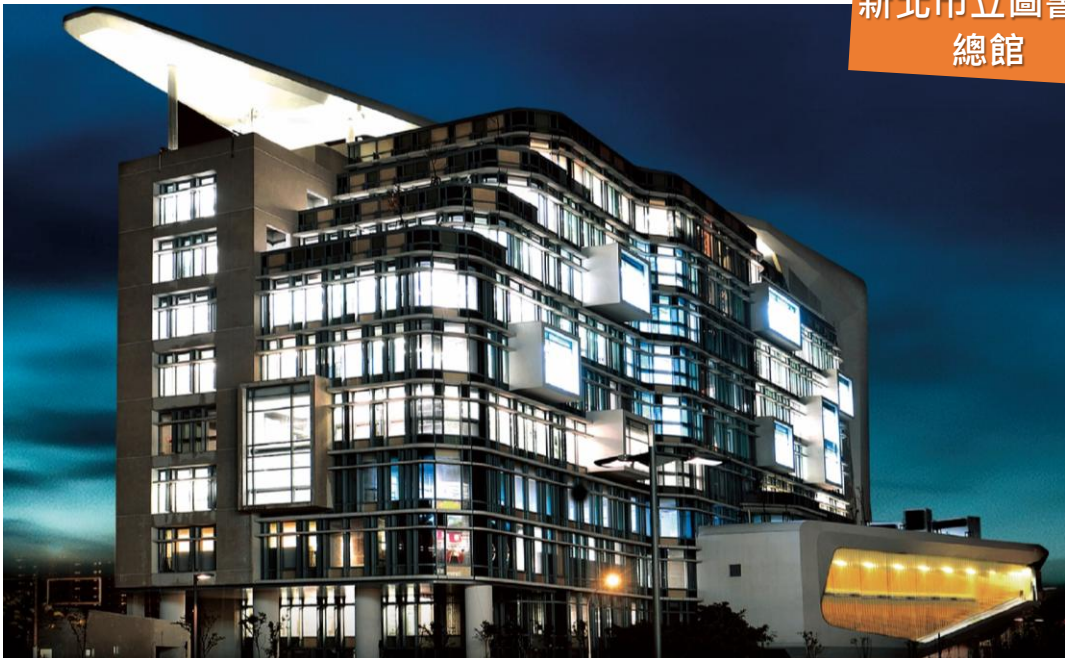
新北市立圖書館 總館

總館於104年5月10日落成，以「讓所有使用者感覺貼心」的全新設計概念，打造全國第一個符合通用設計原則的公共圖書館，希望讓市民享有更安心的友善閱讀環境；同時順應國際性潮流，及都會人口的新生活型態，提供創新的閱讀服務，成為新北市重要的文化地標。依不同年齡層的使用習慣，規劃多樣的閱讀空間，提供分齡分眾的多元閱讀設備與服務，設置世界之窗悅讀角，營造異國風情的閱讀氛圍；利用高架自動倉儲系統，打造全國首創的智慧型全自助預約取書機，並設置自助還書暨分揀機，快速又便利。