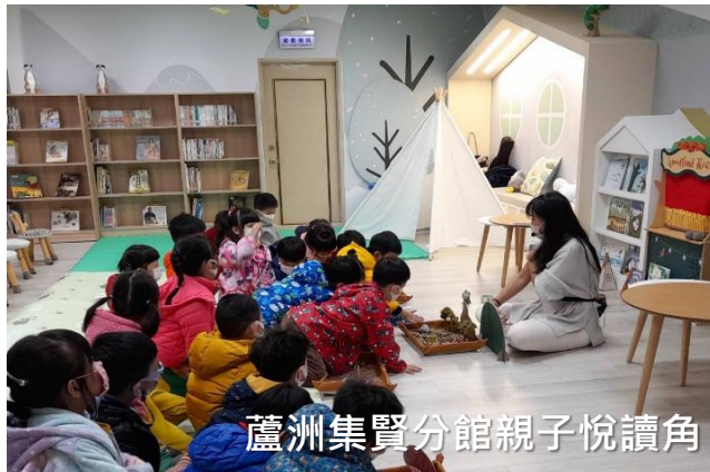
蘆洲集賢分館親子悅讀角