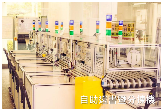
自助還書暨分揀機