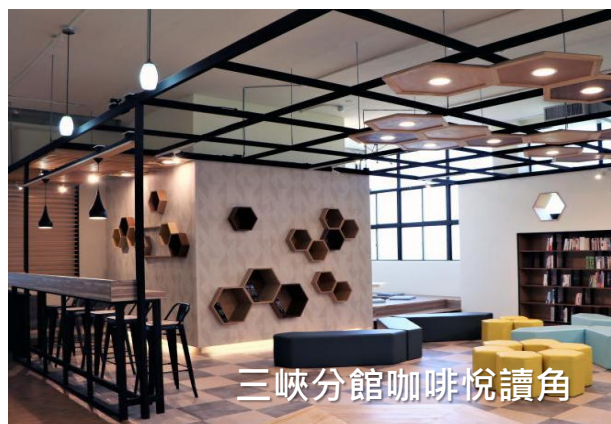
三峽分館咖啡悅讀角